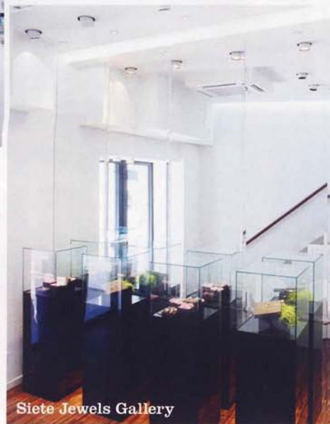
Siete Jewels Gallery

DÉJATE ASESORAR POR LOS EXPERTOS Y APRENDE A DISEÑAR TUS PROPIAS JOYAS EN LA VALENCIANA SIETE JEWELS GALLERY